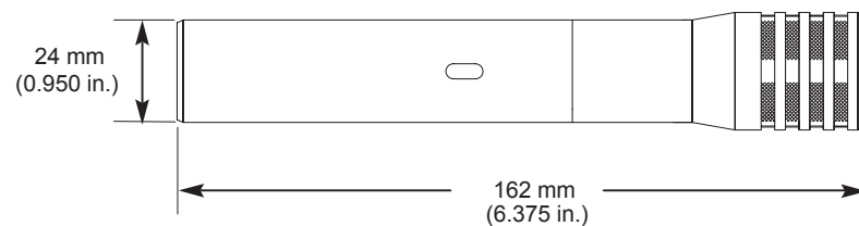
OVERALL DIMENSIONS - DIMENSIONS HORS TOUT

GESAMTABMESSUNGEN - DIMENSIONES TOTALES - DIMENSIONI TOTALI - 寸法